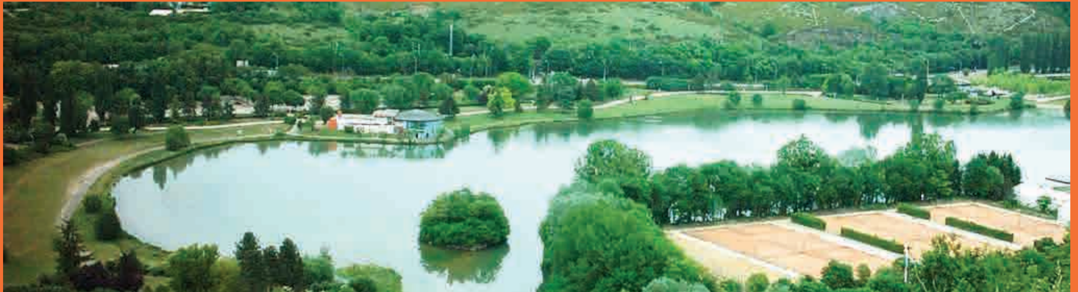
Le lac Kir aujourd'hui dans son écrin de verdure