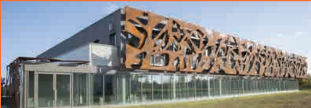
SEM Bâtiment Hope! 64E rue de Sully 21000 Dijon