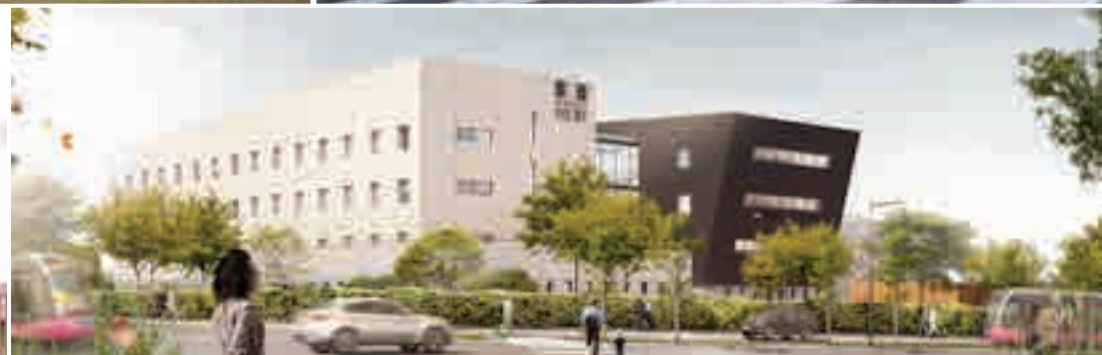
SEM Maison Médicale Vainy © Jean de Nerzy - AIA Architectes