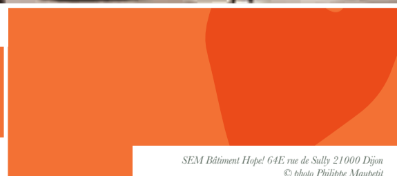
SEM Bâtiment Hope! 64E rue de Sully 21000 Dijon