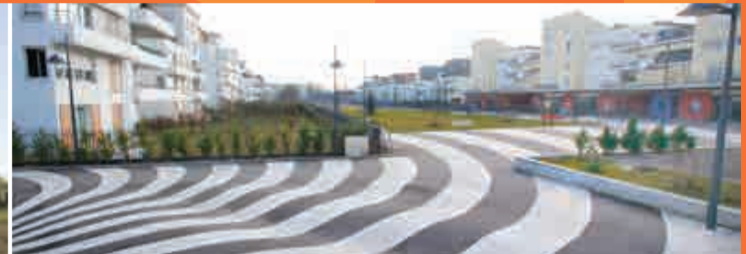
SEMAAD Quartier Junot La Vague, le Baiser, l'Étoile © Ida Tursic & Wilfried Mille, Loïc Raguénès et Cécile Bart