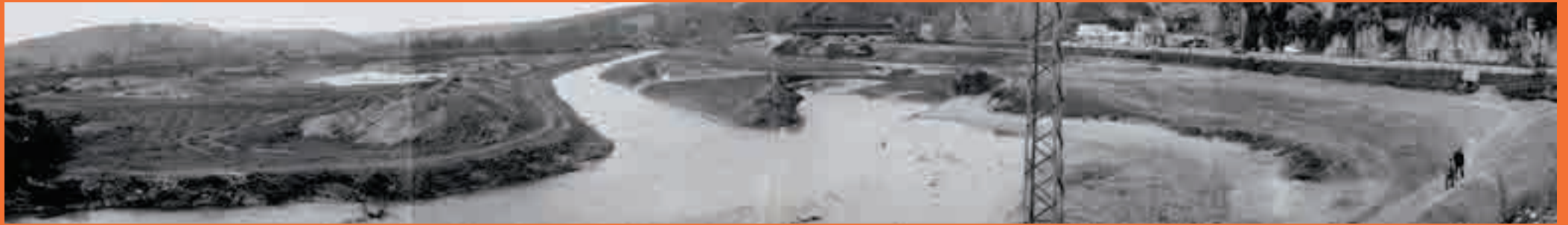
Vue panoramique du lac Kir en cours de réalisation 1963 © photo Bibliothèque Municipale de Dijon Cote L. Est