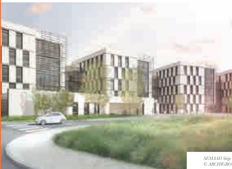
SEMAAD Siège de la CARSAT Bourgogne Franche-Comté © ARCHIGROUP agence d'architecture