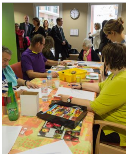
L'inauguration du pôle santé de Valmy en décembre de 2014.